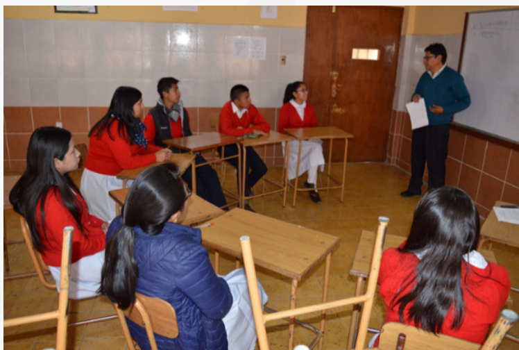
Imagen 1: Grupo de Discusión - Oruro