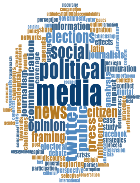
Figura 4 Nube de palabras más frecuentes en los títulos de las investigaciones emergentes

En la figura 3, los abstracts de los artículos recopilados predominan palabras propias del campo de la comunicación digital, tales como “social media”, “community”, “Twitter”, “online”, “tweets”, “posts” y “Facebook”. Otro campo importante es el de la política, en el cual se destacan “politics”, “public”, “elections”, “citizens”, “opinión”, “influence”, “electoral”, “party” y “effects”. Reciben menor atención palabras como “education”, “press”, “institutions” y “concept”.